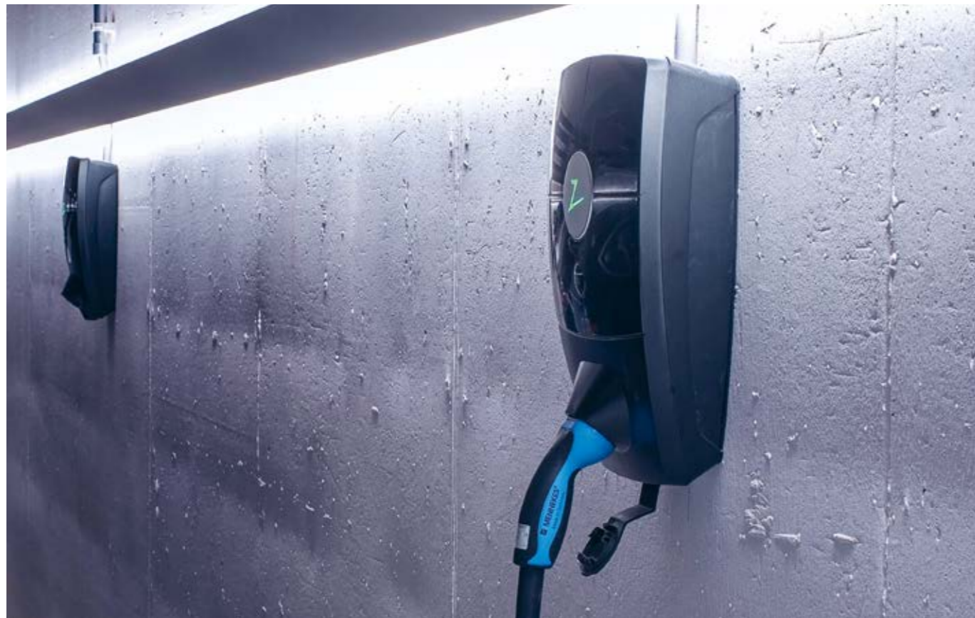
LADESTROM – die einfache, ausbaubare Ladelösung.

Gesamtheitliche Ladelösung für Tiefgaragen in Mehrfamilienhäusern und bei KMUs.