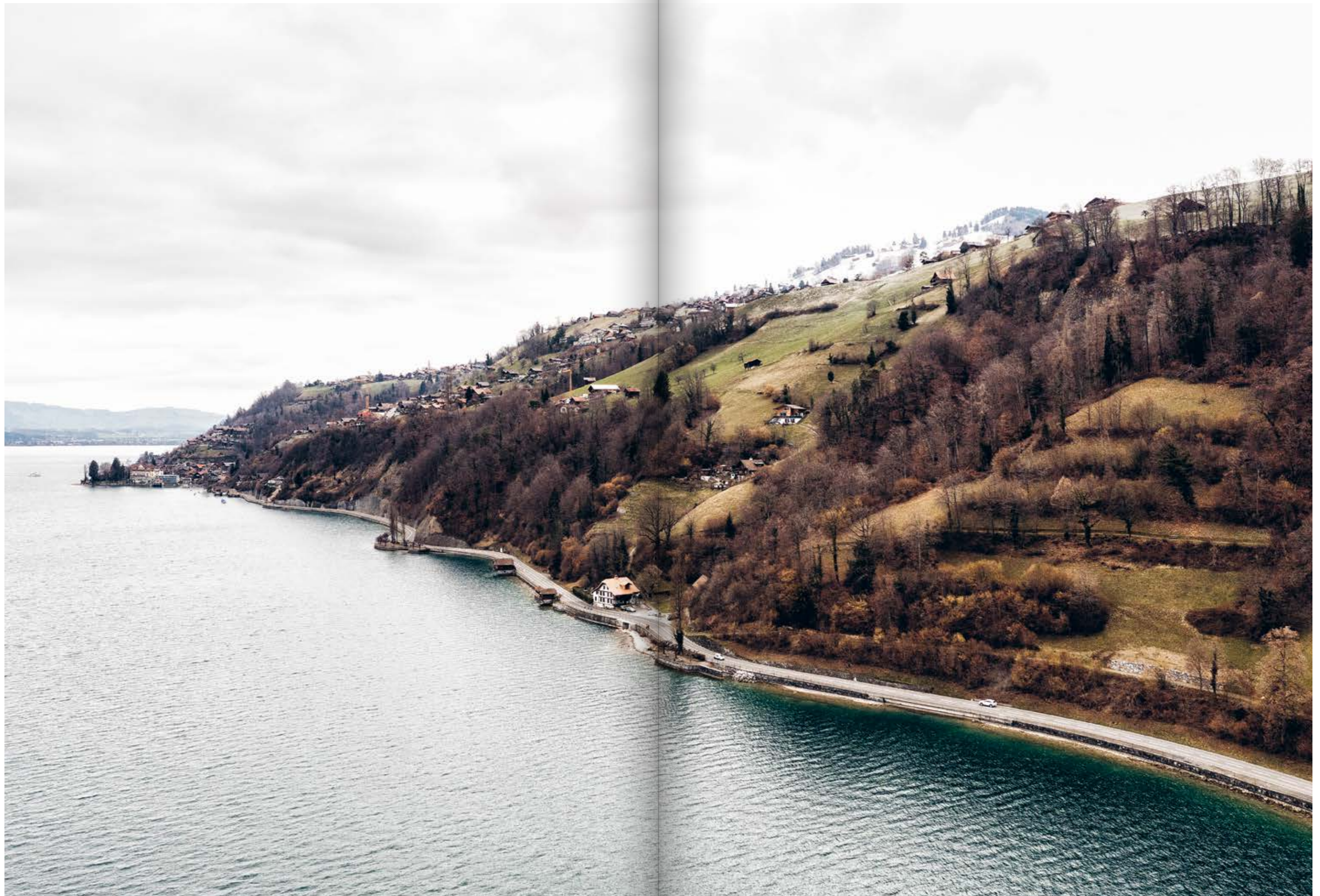
Unten rechts ist die neue Trockenmauer auf dem Gut Ralligen bei Merligen ersichtlich. Näheres dazu auf Seiten 10 und 11.