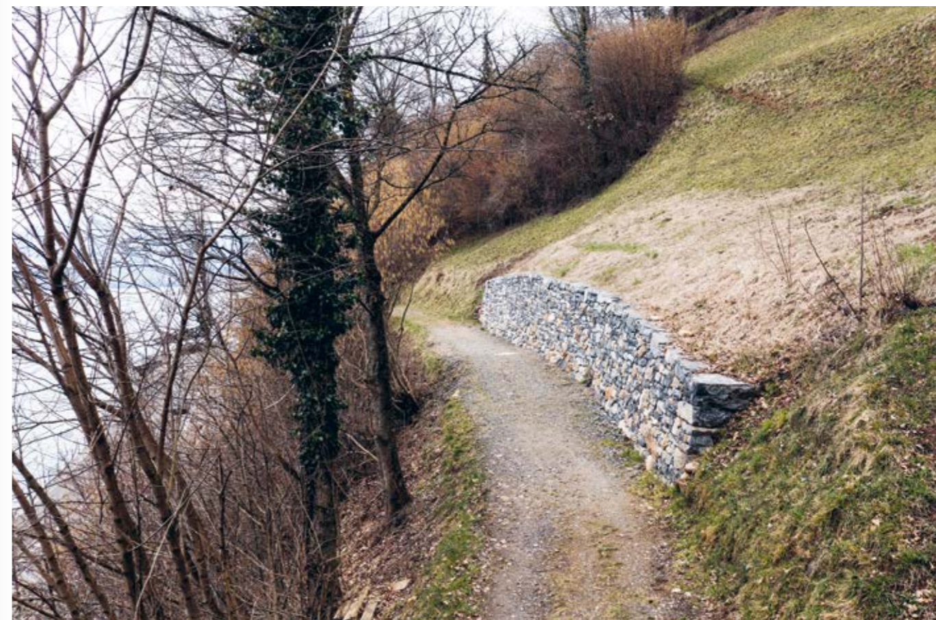
Die Trockenmauer reicht am Fuss 1.5 Meter weit in den Hang hinein.