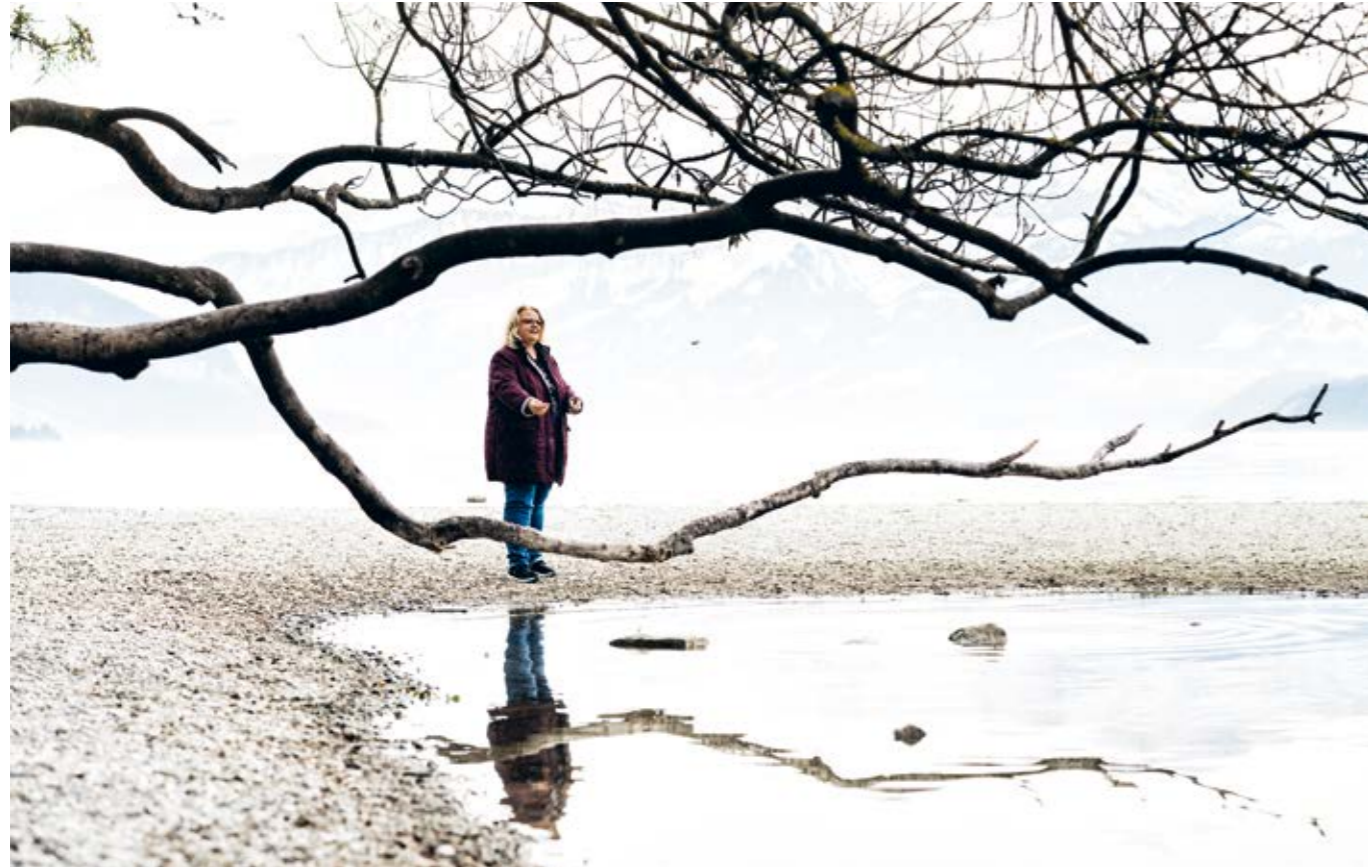
So kann mentales Einstimmen auf die Thunerseespiele-Bühne aussehen.

Sich jedes Jahr neu um die Anstellung bewerben und nicht sicher sein, ob man wieder eine Zusage erhält. Ja, das ist in gewissen Branchen normal.