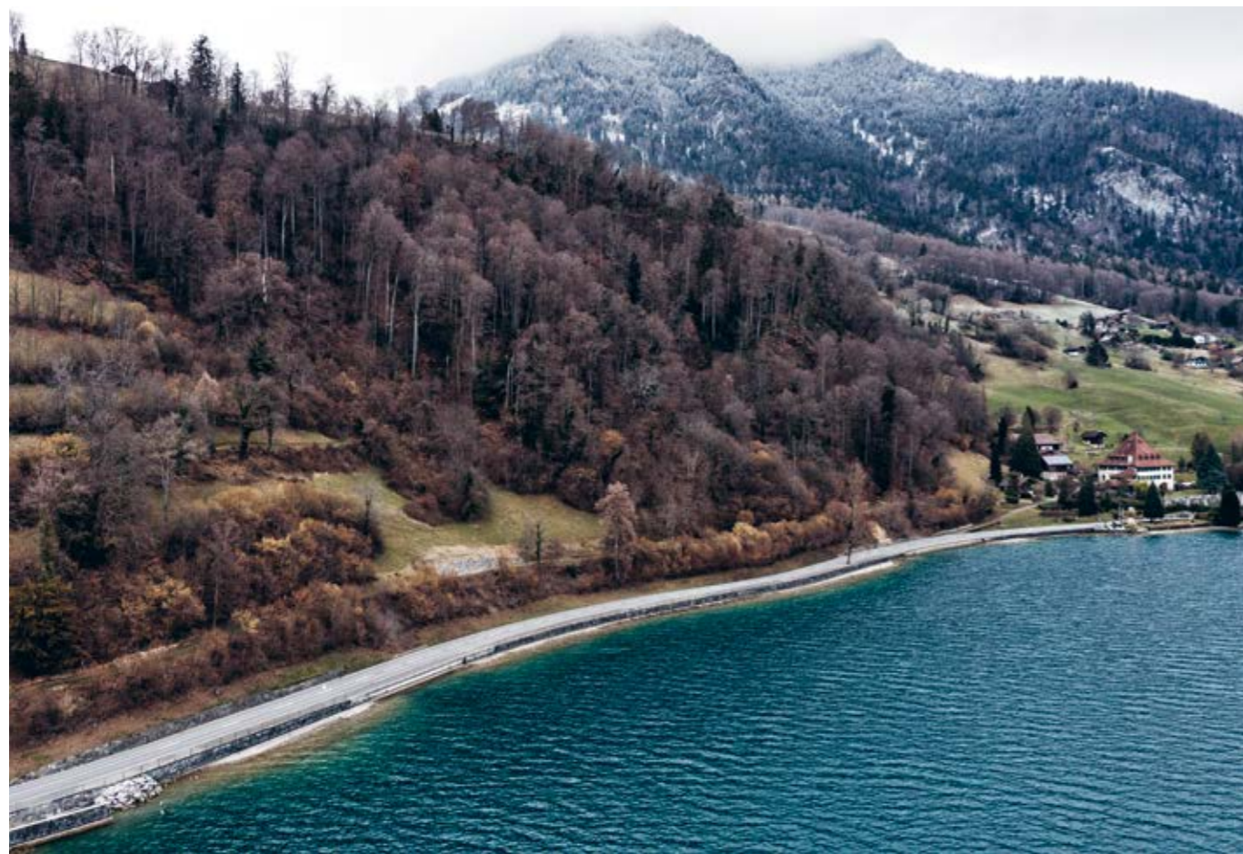
Wer zufällig seinen Blick von der Hauptstrasse hebt, sieht die neue Trockenmauer auf dem Grundstück des Guts Ralligen, Merligen.

Die Trockenmauer ist eine Mauer aus Natur- und Bruchsteinen, die ohne Mörtel erstellt wird. Ein Willkommen für Flora und Fauna.